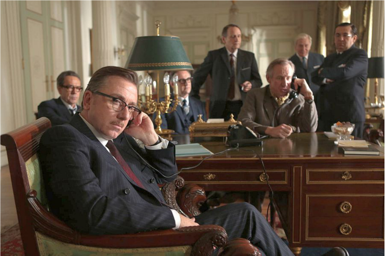
Fyrst Rainier (i forgrunden) og allierede står over for uhyrlige franske trusler Nedenfor: Grace Kelly bliver fyrstinde Grace og finder meningen med sit liv