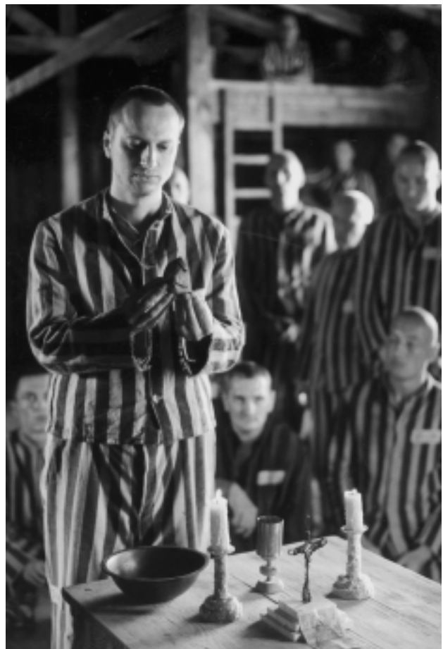
Der so genannte Pfarerberblock im KZ Dachau (Szene aus dem Film DER NEUNTE TAG)

Geheime Staatspolizei (Gestapo) , seit 1939 dem Reichssicherheitshauptamt (RSHA) und seinem Chef Reinhard Heydrich direkt unterstellt, mit Staatspolizeileitstellen auf Landes- bzw. Gau-Ebene und den Staatspolizeistellen bei den Regierungspräsidenten (1941 insgesamt 67). Die Gestapo hatte (seit 1936) „die Aufgabe, alle staatsgefährlichen Bestrebungen im gesamten Staatsgebiet zu erforschen und zu bekämpfen, das Ergebnis der Erhebungen zu sammeln und auszuwerten, die Staatsregierung zu unterrichten und die übrigen Behörden über für sie wichtige Feststellungen auf dem laufenden zu halten und mit Anregungen zu versehen“. Sie war zuständig für nationalsozialistische Terror- und Repressionsmaßnahmen und erließ auf Grund der Reichstagsbrand-Verordnung vom 28. Februar 1933 die Befehle zur Schutzhaft, die zeitlich unbefristet war und ohne Möglichkeit zur Rechtshilfe. 1943 gehörten der Gestapo über 30.000 Personen an.