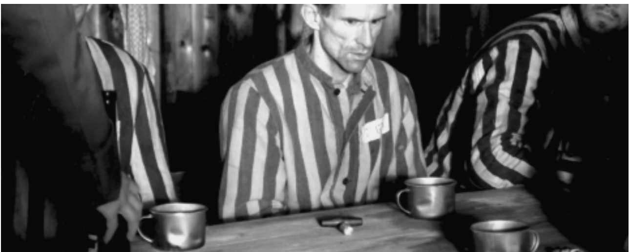
Szene aus dem Film DER NEUNTE TAG

Am 25. Februar trug die Bahn mich wieder dem Elend des Lagers zu. Wie mir dabei zumute war, soll hier nicht weiter beschrieben sein. Gut, dass ich nicht ahnte, dass die Hölle erst beginnen würde.“