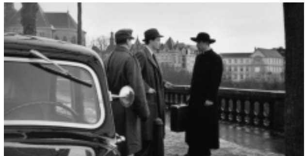
Szene aus dem Film DER NEUNTE TAG