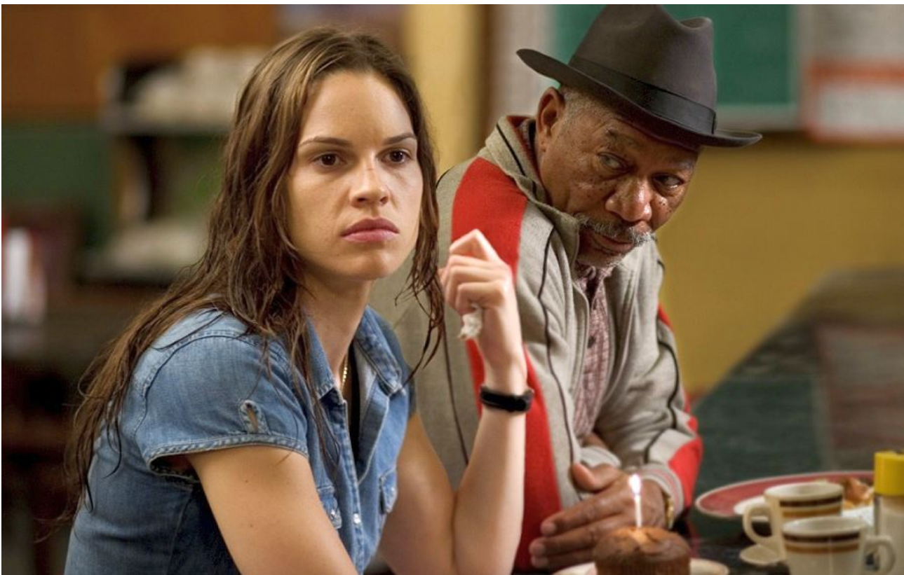
Hilary Swank og Morgan Freeman i "Million Dollar Baby"