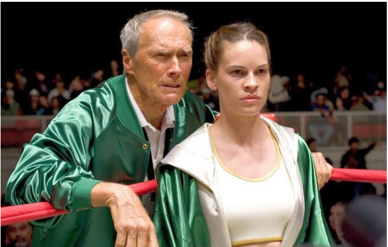
Clint Eastwood og Hilary Swank i "Million Dollar Baby"

Den rent visuelle del bærer præg af Eastwoods lange filmerfaring og er et solidt håndværk